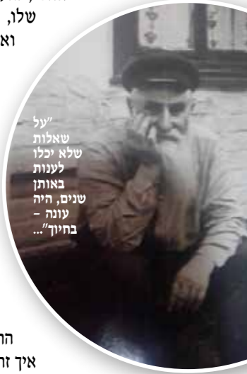
על שאלות לענות באותן שנים, היה עונה - בחינך!...

אני חושב לעצמי: אני בעצמי אבא. אבא יהודי, אבא דתי. כל אבא רוצה שילדיו ילכו בדרכו. הוא מנסה להסביר להם, לספר להם, לחנך אותם, להעביר להם את הידע שלו, את הניסיון שלו ואת האמונות שלו, על-מנת שהם ילכו בדרך בה הוא עצמו מאמין. על אחת כמה וכמה אבא חסידי, ש ל מ ד ב י ש י ב ה בליבואוויטש. לנו, האנשים שגדלו בארצות החופש, קשה להבין איך זה אפשרי. איך סבא יכול לכבוש את רצונו הטבעי