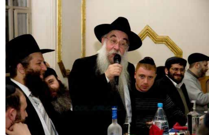
הרב בוטמאן מתוודע עם יהודי זפורוז'יה

השליחה הגב' נעמה אויש, נ"ב, אחראית בין השאר לפעילויות החברתיות ולפעילויות החגים בבית הספר 'אור-אבנר חב"ד' בעירנו זפורוז'יה. באמצע שנת הלימודים הקודמת, בקשר לאירועי בבית-הספר הקשור לתנועת החסידות, היא הגתה רעיון – ללמד את הילדים אודות דמויות חסידיות שהתגוררו ופעלו כאן באוקראינה. הצעתי לפנייה להציג לפני הילדים את דמותו של השוחט החסיד, ר' מאיר-שלמה מלכין, שחי ופעל לא רק באוקראינה, אלא ממש בעיר שלנו. למדו כאן במשך מספיק שנים, כך אמרתי, אודות "געראַי יעוורעסקאַוואַ סאַזוואַ" (גיבורי ברית המועצות. כינוי ברוסית לזקנים עטורי המדליות מהצבא האדום). הגיע הזמן, הוספתי, שילמדו אודות "געראַי יעוורייסקאַוואַ נאַראַדאַ" (גיבורי